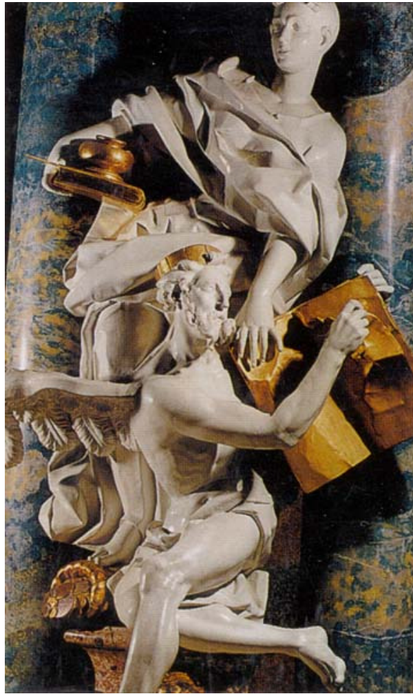
Photo copyright © Atelier Juliane Zizlsperger; scanned from the cover of Paul Ricoeur, La mémoire, l'histoire, l'oubli (Paris: Editions du Seuil, 2000). This photo is used here under the fair use provision of the Copyright Act of 1976. Further reproduction, especially for commercial purposes, may be prohibited by law

פסל מן המאה השמונה עשרה, שניצב בספריית מנזר ויבלינגן בעיר אולם שגרימניה, ובו נראים קליאו, המוזה של ההיסטוריה, מחזיקה ביד ימינה בכלי מקצועה, קסת דיו, וגוויל, וביד שמאלה היא מרסנת את כרונוס המכונה, אל הזמן, המשמיד את עקבות העבר.